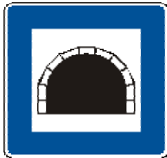
Zeichen 327 Tunnel