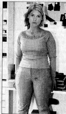
Diese Kapseln sind wirklich Spitze: Ich habe in nur 6 Wochen 25 Kilo abgenommen - die Kilos schmolzen nur so dahin. Es geht ganz einfach, zu keiner Zeit fühlte ich mich hungrig oder müde. Ich fühle mich wie neugeboren, und auch mein Mann findet meine neue Figur überwältigend.